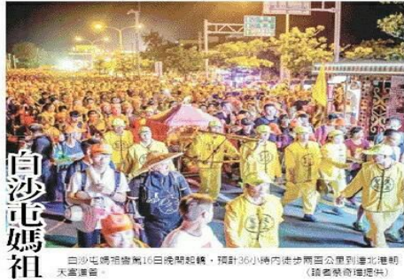
白沙屯媽祖進香團16日晚間起程，預計36小時內抵達北港朝天宮進香。

【本報記者陳建宏雲林報導】苗栗縣通霄鎮大安白沙屯媽祖進香團16日晚間起程，預計36小時內抵達北港朝天宮進香。今年報名信眾超過4萬人，屆時進香隊伍勢必塞滿進香路，往來吸引許多「香豬豬」同行。今年再創以往紀錄，報名人數超過4萬人，是歷年最高，且還有許多進香團加入的盛況，預計到北港廟可突破6萬人以上，今年8天7夜中最嚴峻的一路路程，是36小時要趕200公里從苗栗到北港，行程路線經過苗栗、台中、彰化及雲林縣等4個縣市，對信眾的體力與意志均有相當的考驗。 分局長廖志明表示，為確保交通秩序之順暢及人車之安全，防範治安事故發生，除一警一隊加強巡邏外，也增派警、民防與守望相助等協助民力投入交通疏導任務及預防犯罪宣導，據往年經驗，有常參與進香團信眾在人群中，換機動，雙方會加入人力全程關注引導，同時也會請地方防衛組織協助巡邏。警隊與巡警、防衛團路巡進行警務巡邏，也請給辛勞的警察按個「讚」。