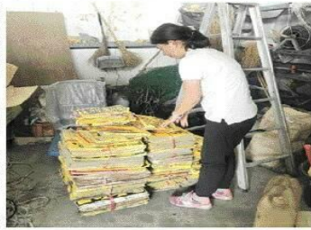
南市環保局推「集撕廣告」活動，願民眾集撕小廣告換全額禮券。

【本報記者黃維勤台南報導】南市環保局積極推出「集撕廣告」拆除廣告物活動，只要新拆除廣告紙、紙板、珍珠板或玻璃廣告物10公斤或純廣告紙4公斤，即可到環保局東區等清潔隊兌換100元全額禮券。今年有萬元全額禮券自即日起兌換，機不可失，歡迎市民踴躍參與，協助清除違規小廣告。 環保局表示，去年舉辦「恢復淨廣告兌換禮券」活動，獲民眾熱烈響應，共拆除14萬件廣告物兌換禮券，其中絕大多數是違規廣告。今年環保局積極推廣廣告物活動，歡迎市民踴躍參與，共同維護市容。 環保局表示，各區清潔隊每天派員巡查市容，拆除、取締違規廣告物。去年共清除的50萬件違規廣告物，其中619件依電信法處以停話，244件依廢棄物清理法開罰告發，但部分不肖業者常利用夜間或清晨時分偷偷張貼廣告物，讓清潔人員趕不勝趕。 環保局指出，拆除小廣告紙只是舉手之勞，但集合眾人力量就能改變市容，期待民眾再次協助政府維護環境，讓市容更乾淨清新，兌換禮券可打電話洽詢。