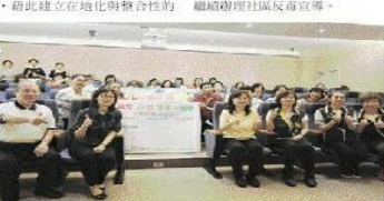
嘉義市政府衛生局在嘉義市衛生局新研發中心舉行反毒社區巡講。

利部食品藥物管理署、慈濟大學、嘉義慈濟分會、職能公會、社區鄰里發展協會及民間組織等，以「職能聯盟」的概念，辦理「反毒教育巡講」人才培訓課程，藉此建立在在地化與整合性的